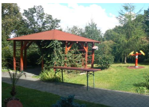
POBYT NA ZAHRADĚ

Autem jezdí na nákupy, výlety, do návazných služeb.