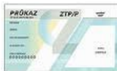
Průkaz ZTP/P, ZTP nebo TP