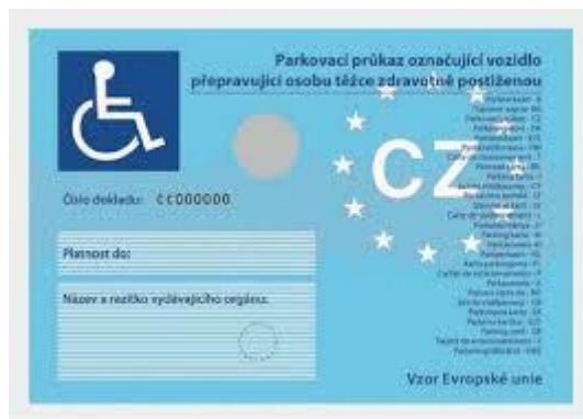
Parkovací karta do auta