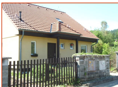
Pod Hůrkou 754/26, Město Albrechtice