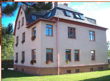
P. Bezruč 141/4, Město Albrechtice