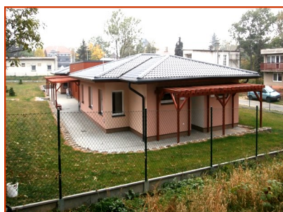
Slunečná 181, Osoblaha