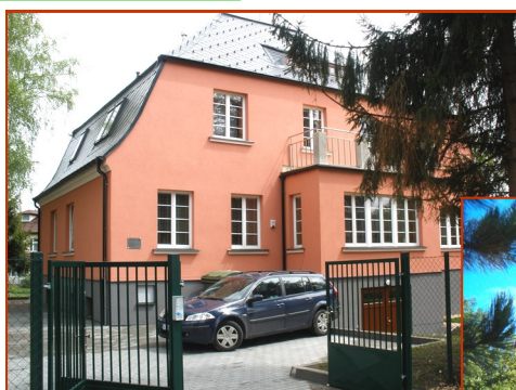
Krnovská 185/1, Město Albrechtice