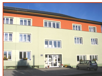
B. Smetany 536/35, Město Albrechtice